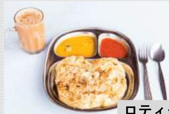
ロティチャナイ Roti Canai