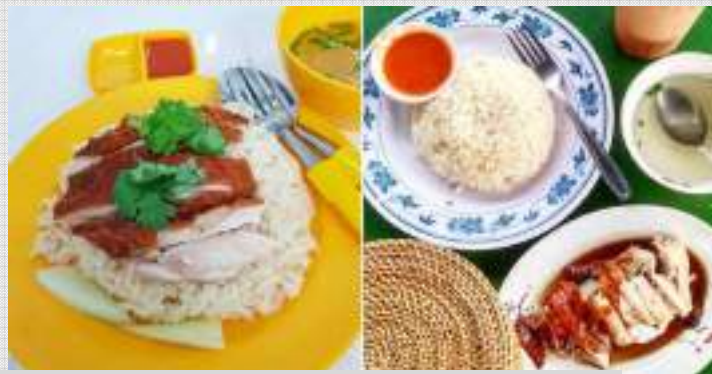
チキンライス Chicken Rice