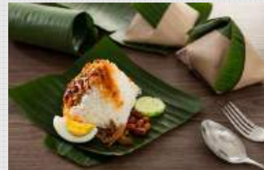
ナシレマツ Nasi Lemak